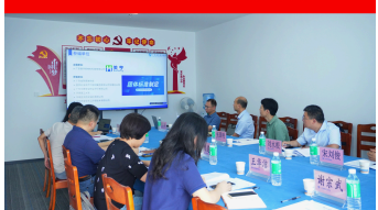
防腐蚀领域团体标准编制会议