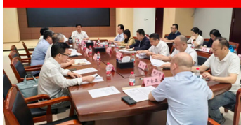
首次行业协会商会“粤商协荟·会长面对面”