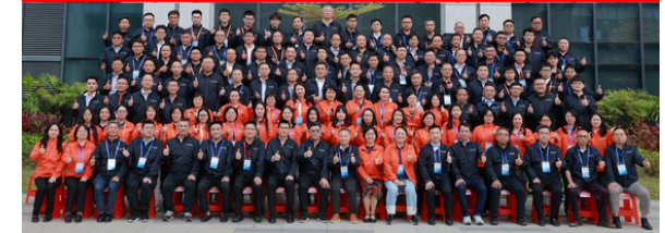
广东省防腐蚀协会第七届会员代表大会暨理事会第一次会议 广东·广州 2026.03.20