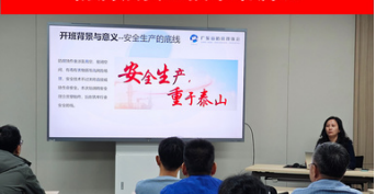
防腐蚀安全技术培训班